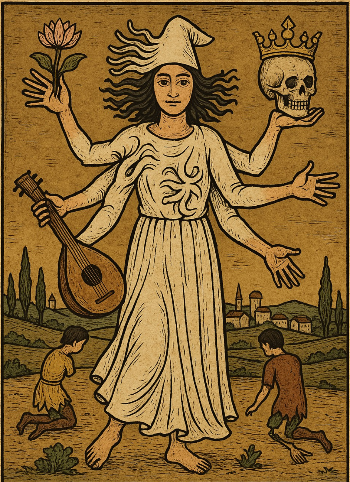
DER MAGIER (DER TROUBADOUR)