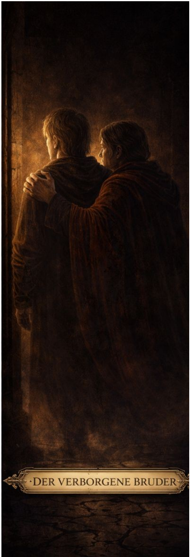
DER VERBORGENE BRUDER