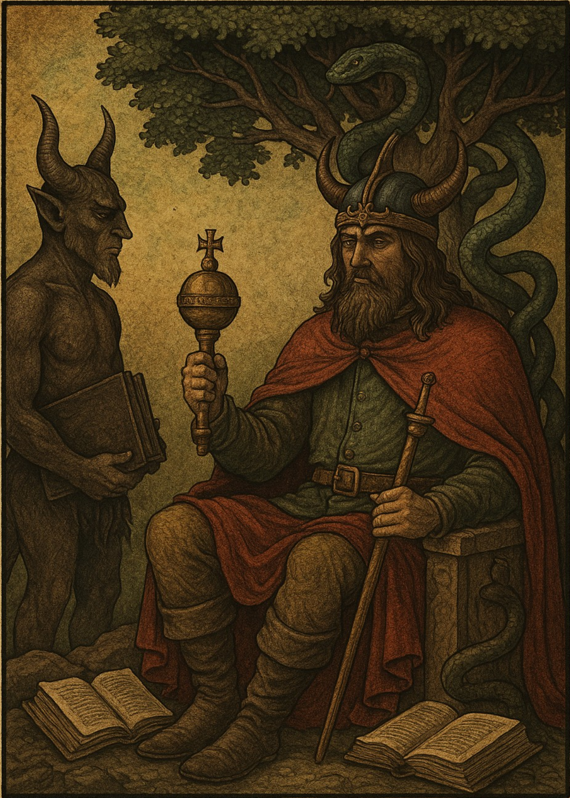
IV DER KAISER DAGOBERT II.