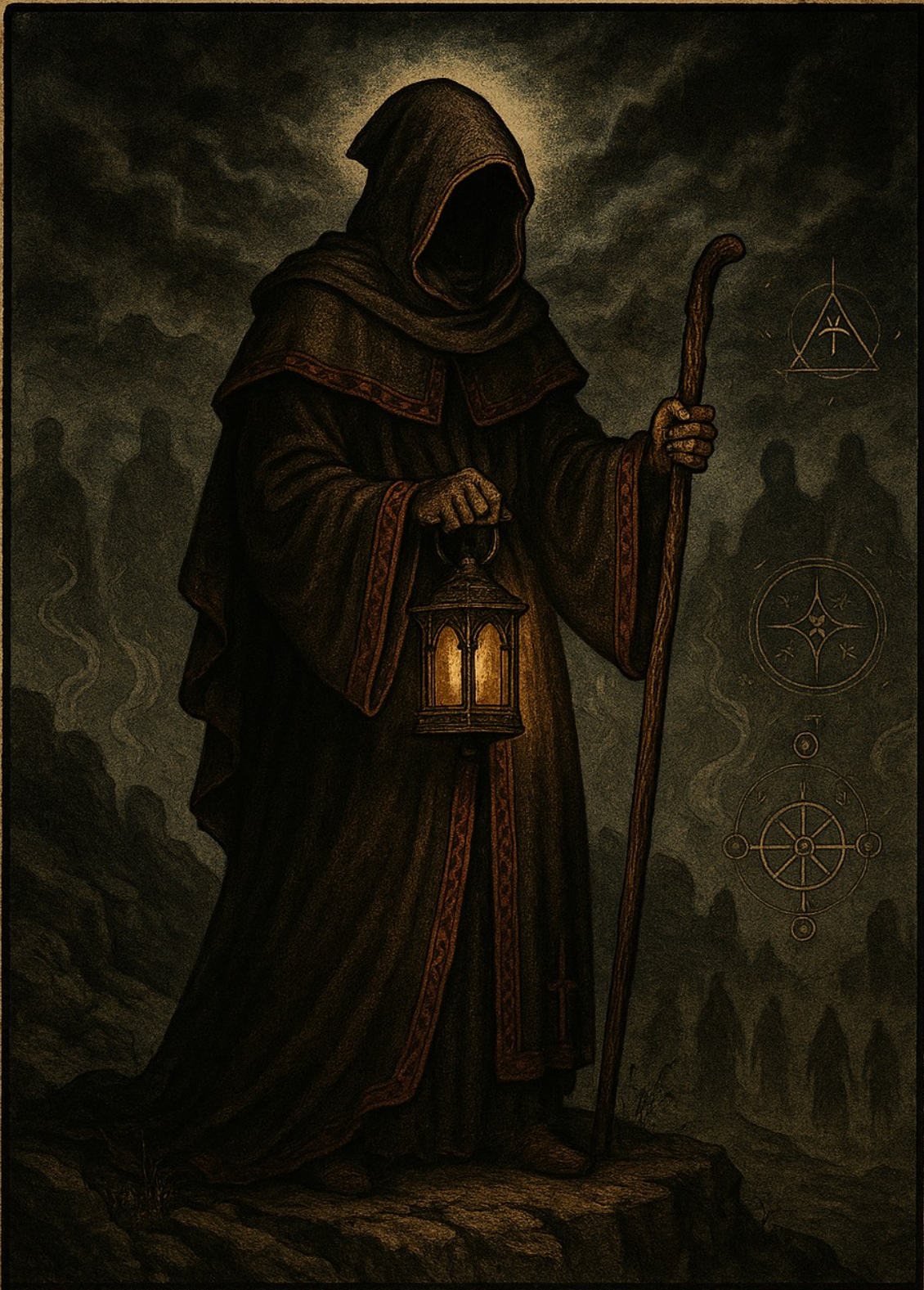
DER EREMIT (JOHANNES DER TÄUFER)