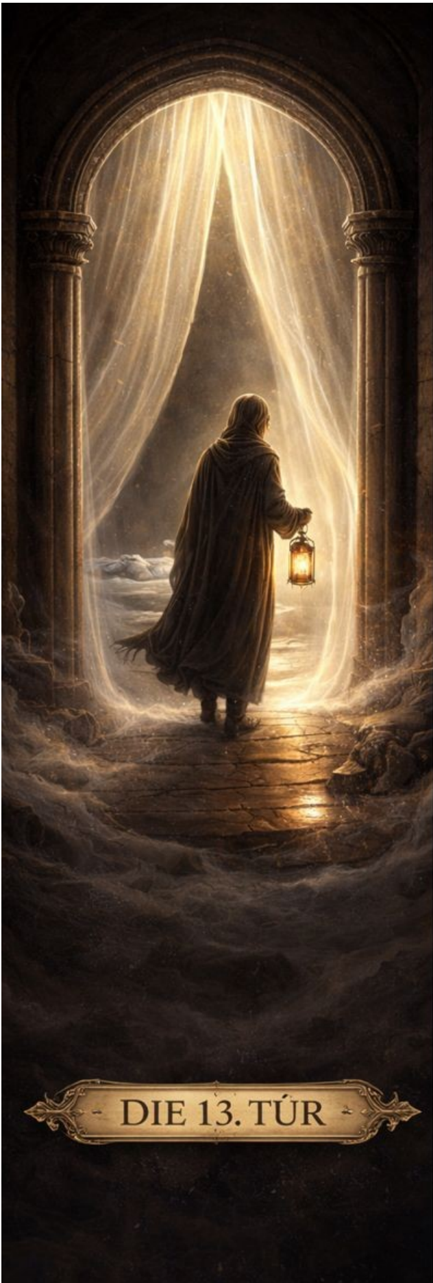
DIE 13. TÜR